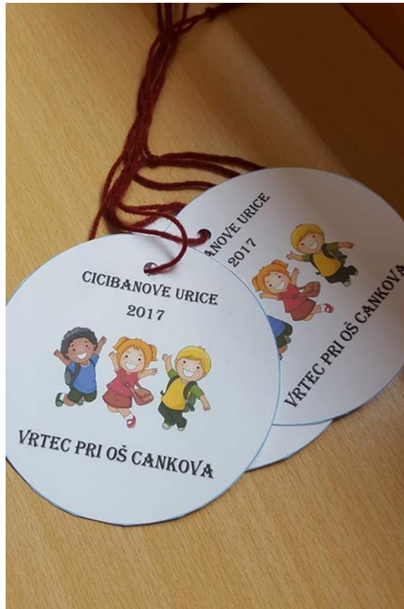
Otroci so ob koncu Cicibanovih uric prejeli medalje.