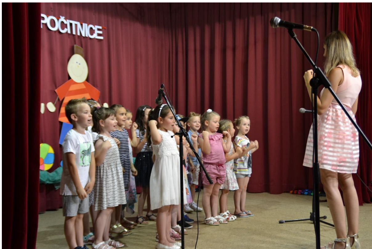
Nastop na zaključni prireditvi vrta pri OŠ Cankova.