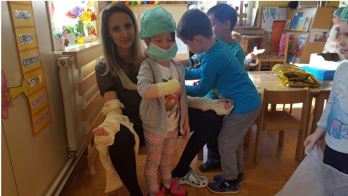
Učimo se prve pomoči.