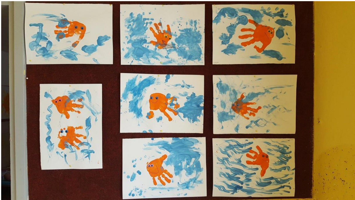
Končno poletje in počitnice. Ampak mi ustvarjamo tudi takrat.