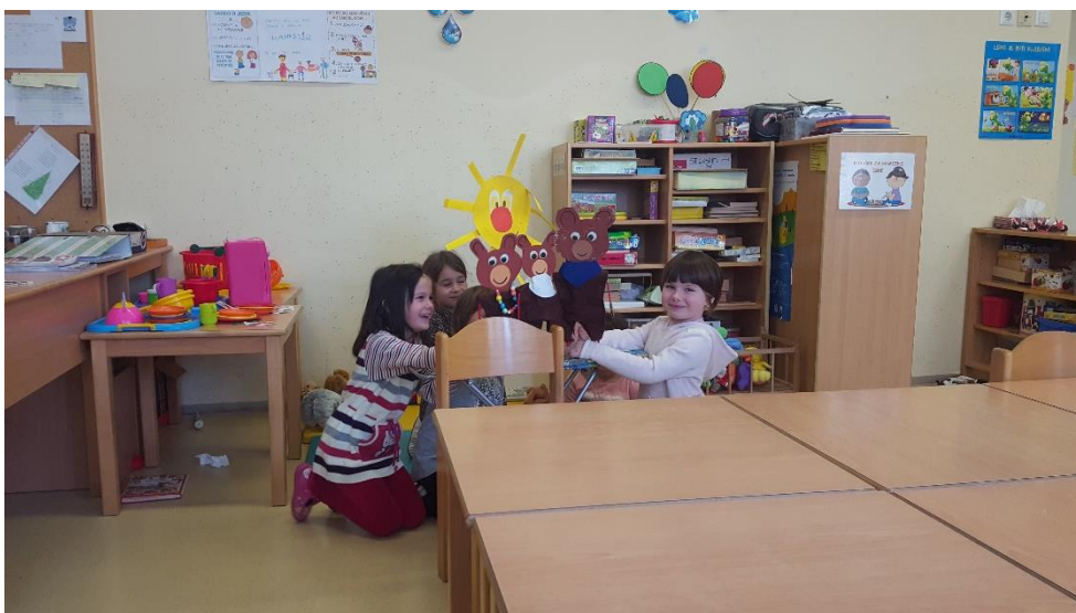
Skupaj s skupino Medvedki smo pripravili kratko predstavo o medvedkih.