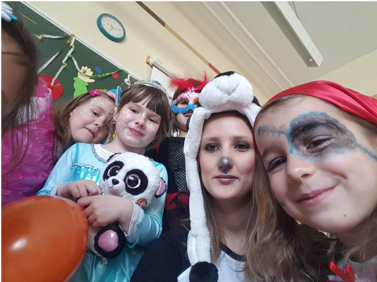
Pust veselih ust.