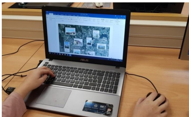
Slika 3: Izdelava sestavljanke ob pomoči računalnika (Foto: M. Hajdinjak, januar 2019)

Predstavljeni primeri dediščine so prikazani na zemljevidu, ki je v obliki sestavljanke. Uporabnik-turist, se seznanja z geografsko lego naselij in z dediščino. Sestavljanke je izdelana ob uporabi Google Eartha in aplikacije Learning Apps-Puzzle Maker.