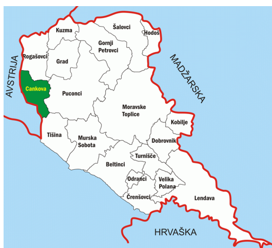
Slika 1: Geografska lega občine Cankova

Občina Cankova zajema območje na skrajnem severovzhodnem delu Slovenije. Pokrajino onkraj Mure geografsko delimo na Pomursko ravnino in Goričko, v jugovzhodnem delu pa se raztezajo še Lendavske gorice. Območje občine Cankova leži v jugozahodnem delu Goričkega, ob avstrijski meji, kot prikazuje slika 1.