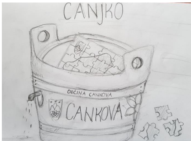
Slika 8: Skica turističnega spominka