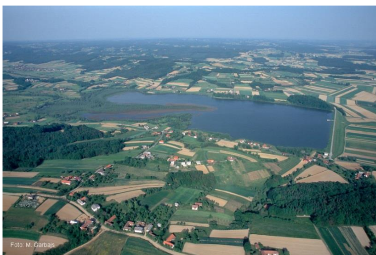
Slika 4: Ledavsko jezero

Ob jezeru in v njegovi neposredni bližini najdemo tudi primere dediščine oziroma različne možnosti za rekreacijo, ki so lahko dodatna ponudba za razvoj turizma.