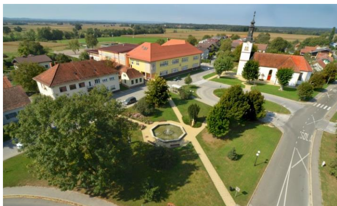
Slika 2: Cankova kot občinsko središčno naselje