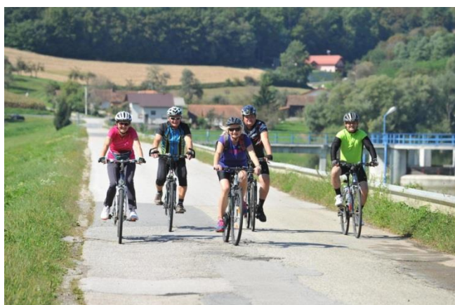
Slika 5: Kolesarjenje po poti v okviru Voglerjevih dnevov

Voglerjeva kolesarska pot je hkrati mobilna učna pot. Dolga je 24 km, na poti je 15 znamenitosti, na vsaki točki je zanimivost, kjer je več izzivov. Po poti se lahko podate peš ali s kolesom. Start krožne poti je v parku, cilj pa na Voglerjevem dvorišču. Izzivi, ki jih rešuje obiskovalec so geografsko in zgodovinsko povezani. 21