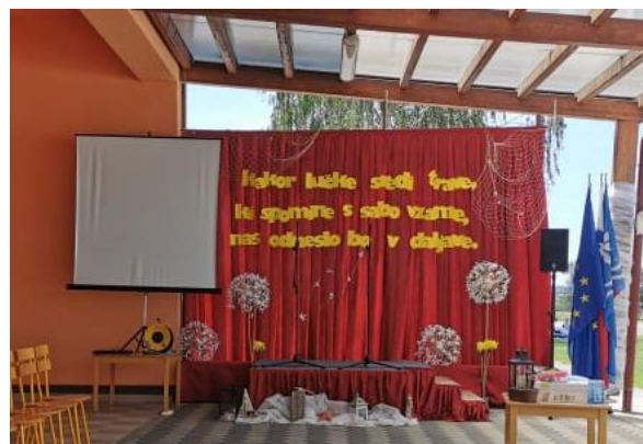
Priprava vaje za 9. razred