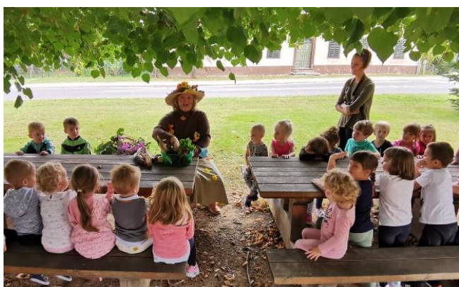
Tetka jesen v vrtcu