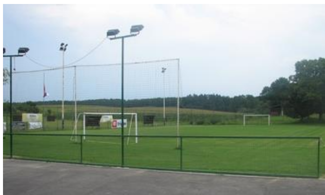
Slika 2: Nogometno igrišče v Korovcih

V občini Cankova je prisotnih kar nekaj površin namenjenih rekreaciji. V nekaterih naseljih so prisotna nogometna igrišča (Cankova, Domajinci, Korovci). Na voljo so tudi manjša košarkarska igrišča ter atletska steza ob šoli na Cankovi. Na Cankovi je tudi telovadnica, ki pa je namenjena samo učencem šole ter otrokom iz vrtca.