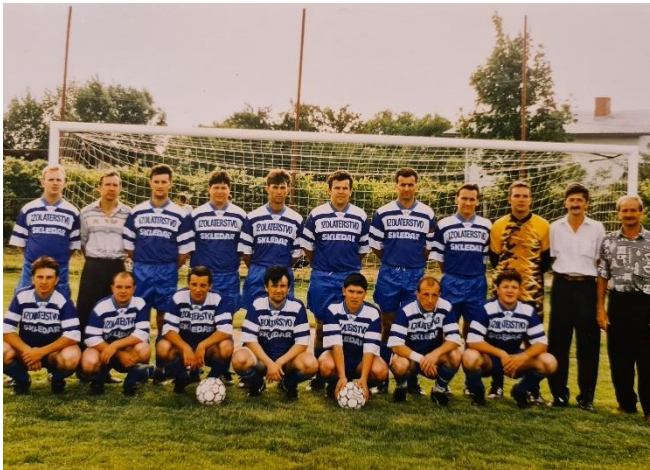
Slika 6: NK Cankova

Klub je skozi čas doživel mnogo vzponov in padcev. V tekmovalni sezoni 1976/77 so nogometaši Cankove zasedli 3.mesto v Občinski nogometni ligi M. Sobota (ONL), z 24 točkami. V naslednjih letih od 1977 – 1981 niso tekmovali v ONL MS. V sezoni 1981/82 so zasedli 6. mesto in 14 točk med 9 ekipami ONL MS. V sezoni 1982/83 so dosegli 2.mesto in 19 točk, v sezoni 1983/84 pa 5.mesto in 15 točk. V sezoni 1984/85 so dosegli 4.mesto z 15 točkami. Najuspešnejša je bila sezona 1985/86, ko so bili zmagovalci sezone lige MNL z 16 točkami. V letih 1986-1990 niso sodelovali v ONL MS. V sezoni 1990/91 so dosegli 6.mesto in 23 točk, v sezoni 1991/92 5.mesto in 25 točk, v sezoni 1992/93 9.mesto in 25 točk in v sezoni 1993/94 11.mesto in 20 točk. V obdobju 1994-99 spet niso tekmovali v ONL MS. V tekmovalni sezoni 1999/2000 so dosegli 6.mesto z 33 točkami, v sezoni 2000/2001 pa 8. mesto z 28 točkami. V tekmovalni sezoni 2001/02 so dosegli 8.mesto z 25 točkami in 2002/03 pa 11.mesto z 11 točkami. V obdobju 2003-2006 spet niso tekmovali v MNL MS. V sezoni 2006/07 so dosegli 10.mesto in 21 točk, v sezoni 2008/09 pa so bili zadnji na lestvici le z 7 točkami. V sezoni 2007/08 niso tekmovali v MNL MS. 14