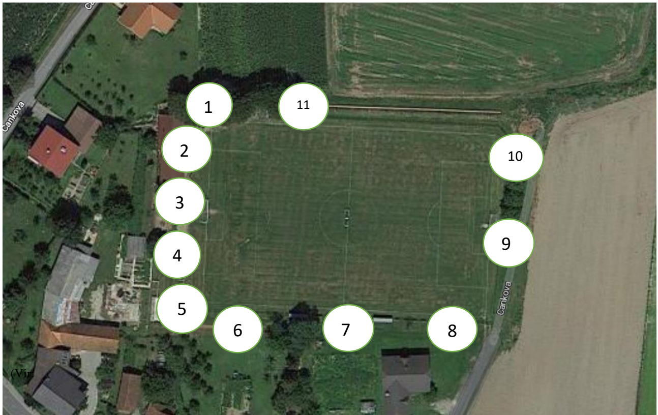
Slika 10: Prireditveni prostor