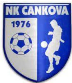
Slika 4: Grb NK Cankova (Vir: http://www.nk-serdica.net/team/nk-cankova/ , 16.1.2023)