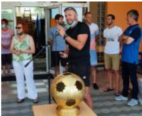
Slika 9: Obisk prvakov na šoli

na tej prireditvi bi jih povabili k sodelovanju. Sodelovali bi na postaji streljanja enajstmetrovk in trener vežba. Z njimi bi se tudi fotografirali.