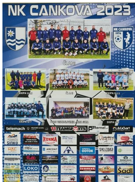
Slika 8: Koledar NK Cankova za leto 2023

Nogometaši na Cankovi so še aktivni. Sodelujejo v 2.pomurski nogometni ligi. Dobro je sodelovanje s šolo. Prirejajo turnirje in nogometne počitnice za mlade. Vsako leto izdajo koledar in sodelujejo v pustni povorki. So pomemben povezovalni člen v dogajanju na Cankovi in širši okolici.