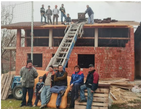
Slika 3: Gradnja prostorov za NK Cankova ob igrišču