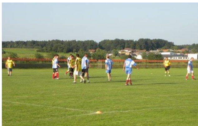
Slika 7: Utrinek z ene od tekem na prireditvi Nogomet na Cankovi še živi iz leta 2011