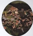
Sicheldorf/ Zetinci 90 Haushalte und 393 Einwohner, Stand 2016

Im Jahr 1825 erstmals schriftlich erwähnt. Die Ortsname ist deutscher Ursprungs und das Dorf ein Siedlerdorf. In einem Dokument von 1825 erwähnt der Herr Leibel auf und war ein Siedler in der Gegend.