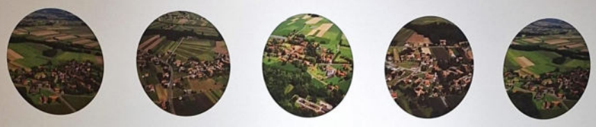
Dedenitz/ Dedonci 151 Hauszahl und 88 Einwohner, Stand 2014