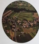
Goritz/ Gorica 96 Haushalte und 323 Einwohner, Stand 2016

Dieses Ort war ursprünglich ein Besitz der Herren von Witten und wurde nach dem Verkauf „Zetzing“ als weiches und das Dorf im Jahre 1362 erstmals schriftlich erwähnt. Dedenitz (Steinwieser Dedenitz), wie man das Dorf heute nennt, war ursprünglich eine Kolonisationsgründung mit Slaven.