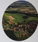
Zetzing/ Zenkevi 91 Haushalte und 323 Einwohner, Stand 2016

Im Jahr 1862 erstmals schriftlich erwähnt. Sicheldorf gehört zusammen mit Zetzing zu den ursprünglichen Siedlerdörfern. Die Siedlung wurde im Jahr 1862 erstmals schriftlich erwähnt, die Siedlung wurde im Jahr 1862 erstmals schriftlich erwähnt, die Siedlung wurde im Jahr 1862 erstmals schriftlich erwähnt.