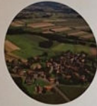
Dedenitz/ Dedenci 93 Haushalte und 393 Einwohner, Stand 2016

Dieses Ort war ursprünglich ein Besitz der Herren von Witten und wurde nach dem Verkauf „Zetzing“ als weiches und das Dorf im Jahre 1362 erstmals schriftlich erwähnt. Dedenitz (Steinwieser Dedenitz), wie man das Dorf heute nennt, war ursprünglich eine Kolonisationsgründung mit Slaven.