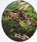
Laafeld/ Potrna 97 Haushalte und 337 Einwohner, Stand 2016

Im 1724 Witten-Gut, wie im Jahr 1862 zum ersten Mal erwähnt. Die Besiedlung „Zetzing“ für den Dorfgründer, die in einer Urkunde erwähnt wird, auf eine deutsche Siedlung hin. Auch der Ortsname ist eindeutig slawisch und bedeutet „eine große, alte“.